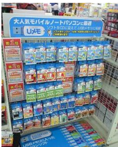
ミニパッケージ版で多くのラインアップを展開可能 (都内家電量販店 パソコン本体売場の展開例)

パソコンソフト売場だけでなく、パソコン本体売場でネットブックやノートパソコンと一緒に弊社の「Uメモ™」シリーズを販売する店舗が、1,000店舗を超え(総家電量販店店舗数の約50%)売り場が拡大しております。タイトル数の増加に合わせて、さらに多くのタイトルが展示できる、ミニパッケージ用の専用仕器も新たに開発いたしました。