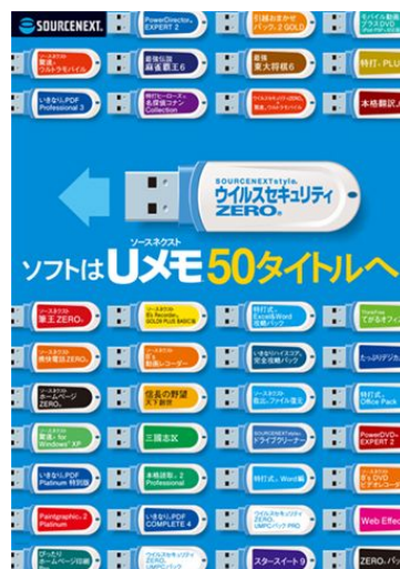
50タイトルを打ち出した販促展開