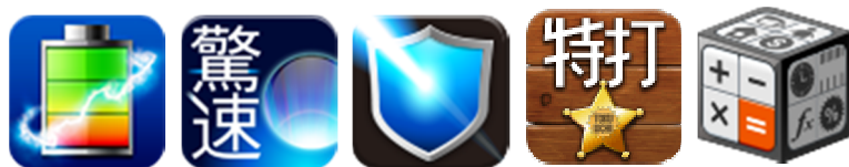
5つのアプリを提供