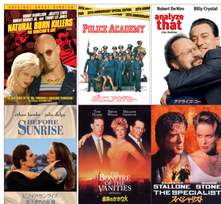
「超字幕/ビフォア・サンライズ 恋人までの距離(ディスタンス)」

<発売タイトル> 各 1,800 円(4月1日(日)までのキャンペーン価格:900 円)