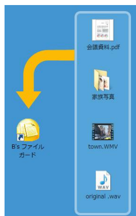
暗号化したいファイルをドラッグ&ドロップ

デスクトップ上のアイコンにドラッグ&ドロップするほか、右クリックメニューからも簡単に暗号化することができます。暗号化の解除もファイルをダブルクリックしてパスワードを入力するだけの簡単操作です。