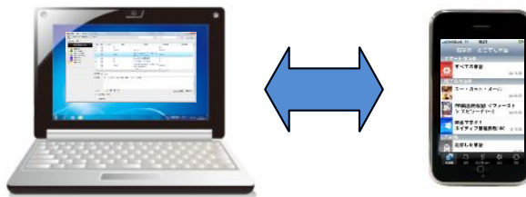
「ユー・ガット・メール」© 1998 Warner Bros. Entertainment Inc. All rights reserved. 「ER」ER © 1995 Warner Bros. Television. Artwork © 2009 Warner Bros. Entertainment Inc. All rights reserved.

※お手持ちのiPhoneに無料アプリケーション「超字幕® どこでも単語」をインストールしておく必要があります。