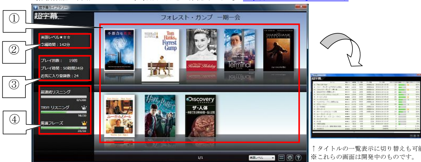
↑タイトルの一覧表示に切り替えも可能 ※これらの画面は開発中のものです。

搭載機能の詳細については、専用サイトをご確認ください。 http://www.chou-jimaku.com/